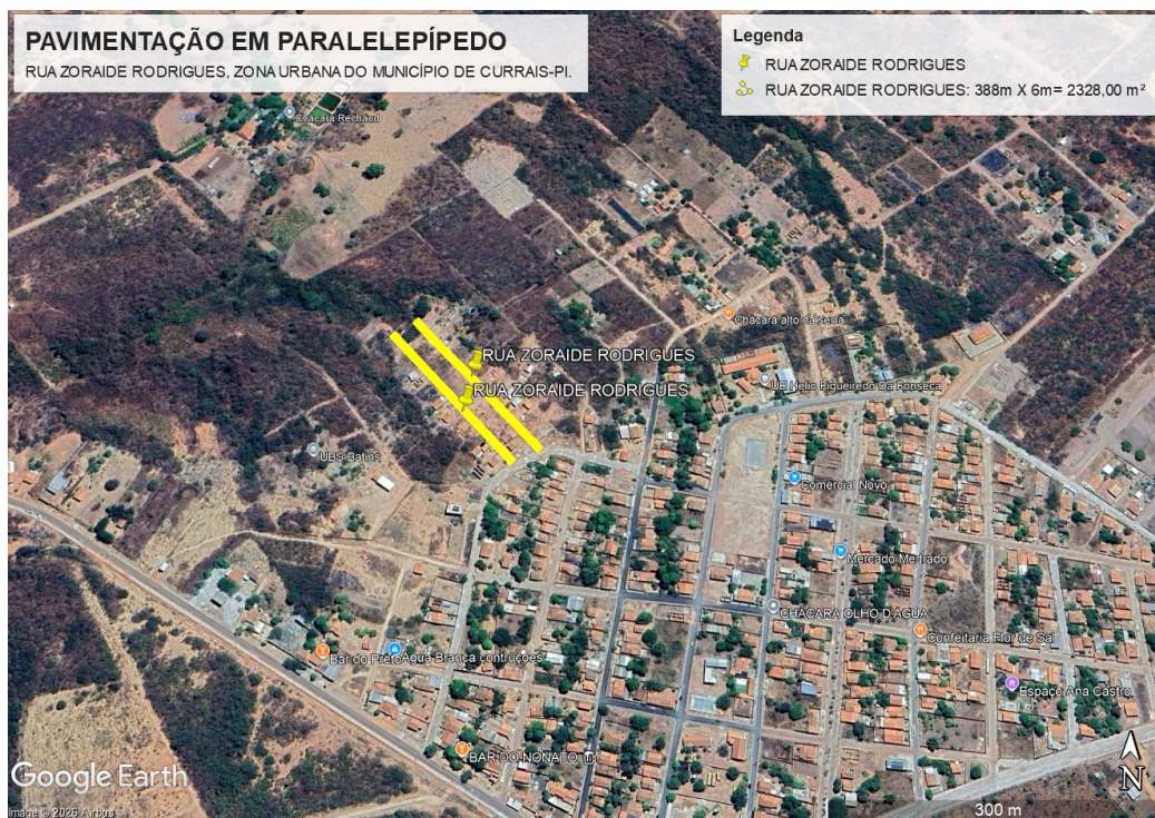
Figura 1: Planta iluminada da Pavimentação das Vias Públicas.