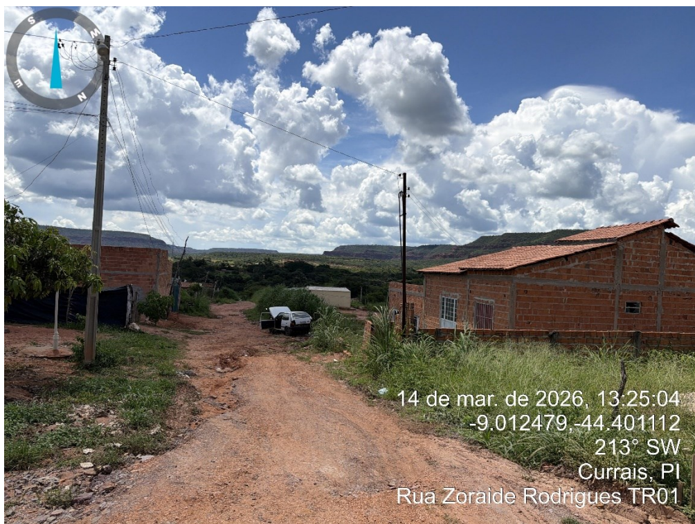
Figura 3: RUA ZORAIDE RODRIGUES