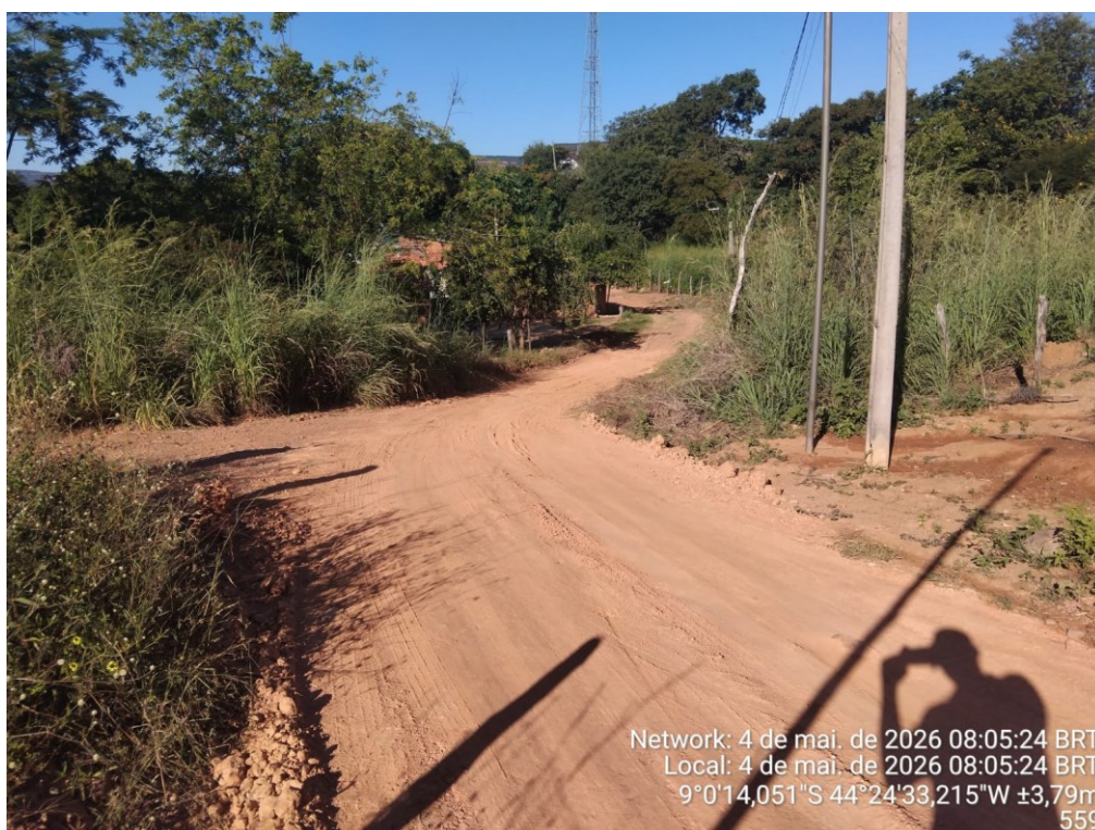
Figura 8: AVENIDA PADRE MANOEL PAREDES