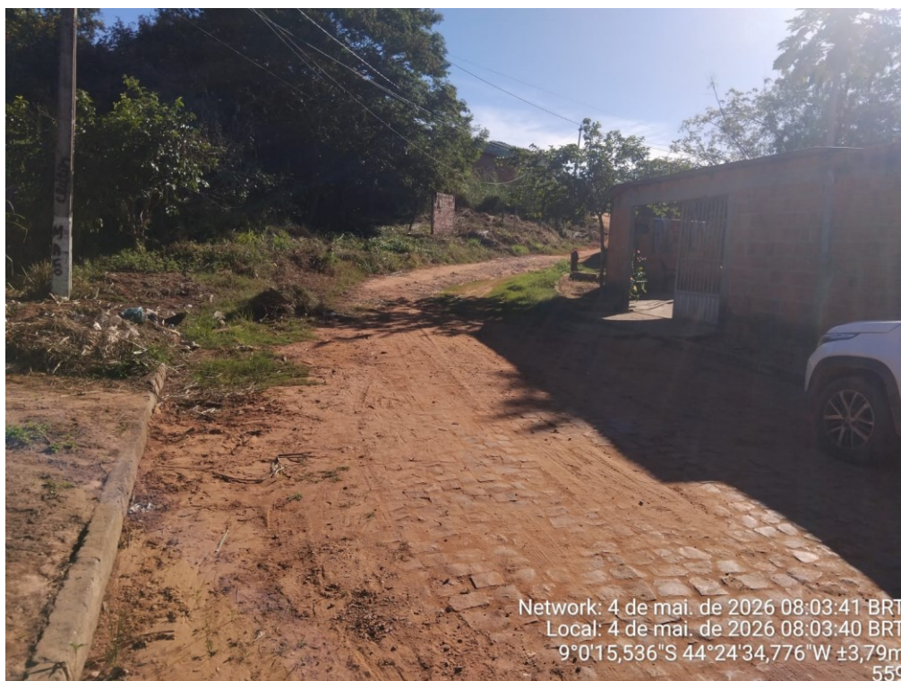
Figura 7: AVENIDA PADRE MANOEL PAREDES