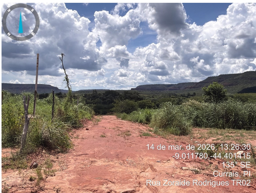
Figura 6: RUA ZORAIDE RODRIGUES