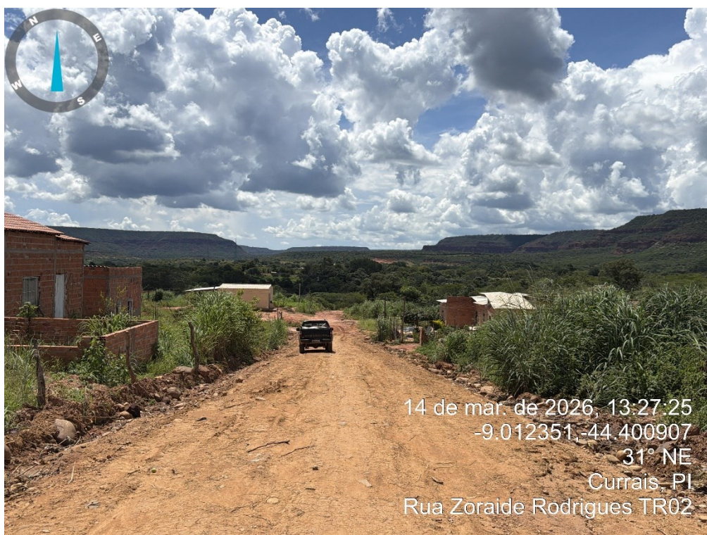
Figura 5: RUA ZORAIDE RODRIGUES