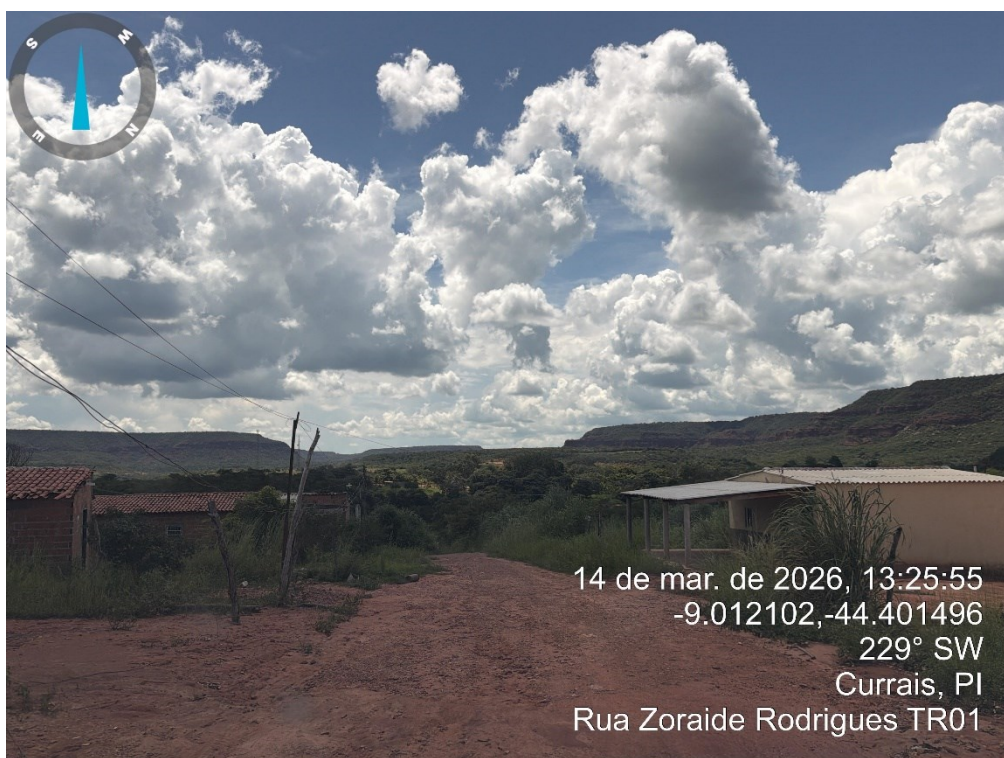
Figura 4: RUA ZORAIDE RODRIGUES