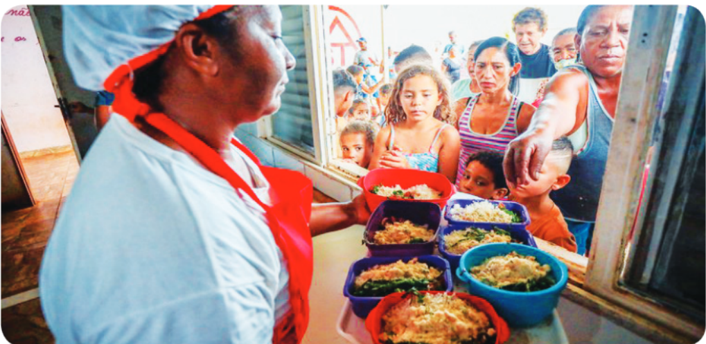
Roberta Aline / IMDS

24,4 MILHÕES DE PESSOAS SAÍRAM DA SITUAÇÃO DE FOME NO BRASIL EM 2023