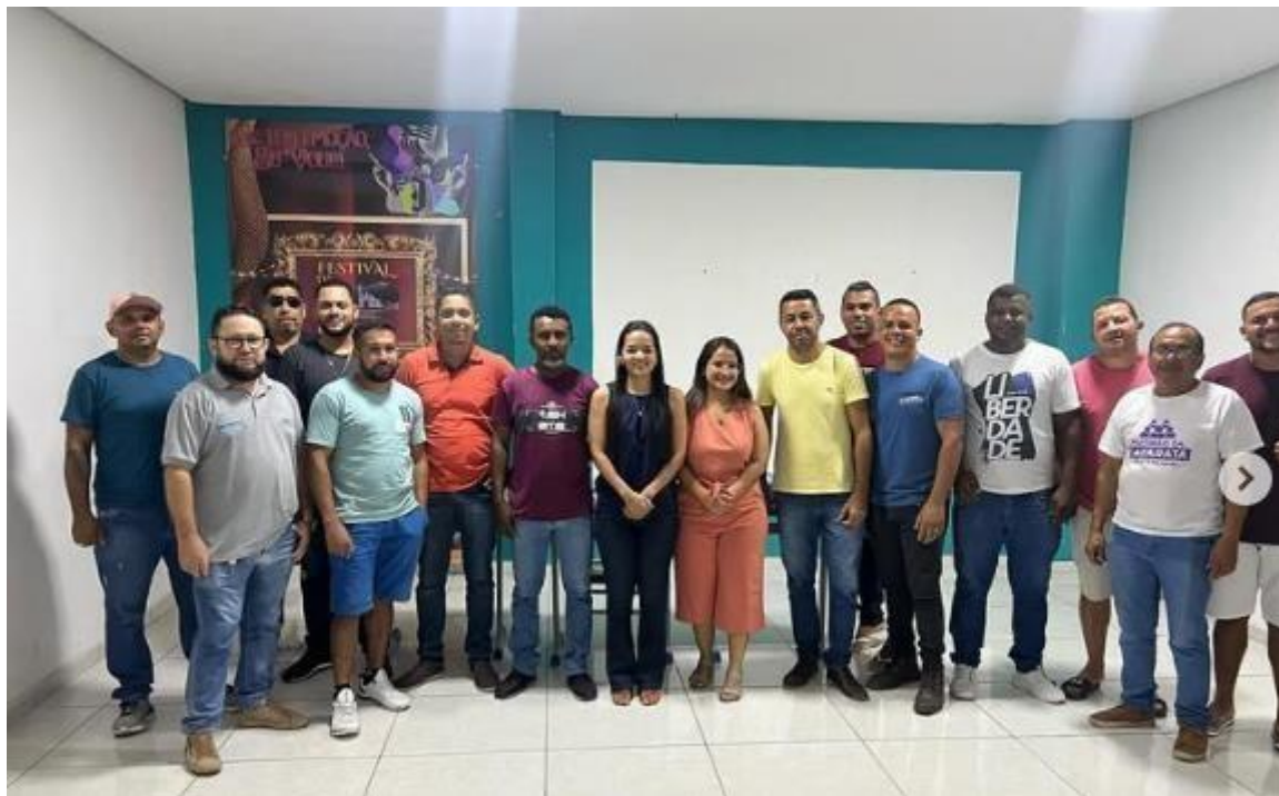
Encontro de Gestante