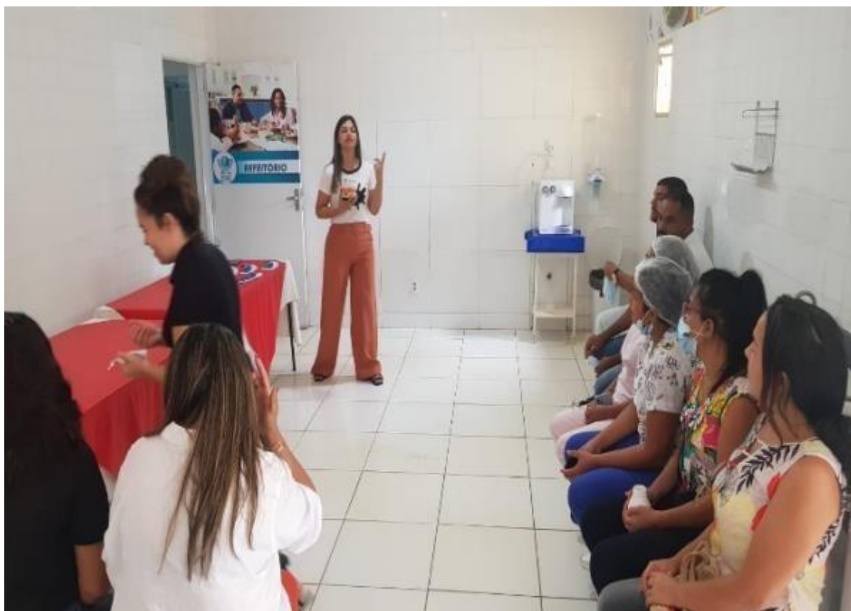
Dia Mundial do Espectro Autista (TEA)