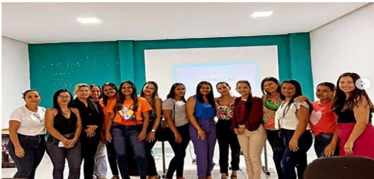
PSE- PROGRAMA SAÚDE NA ESCOLA

Capacitação para as atendentes de todos os estabelecimentos de saúde do município.