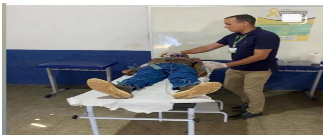
Regulação de Pacientes