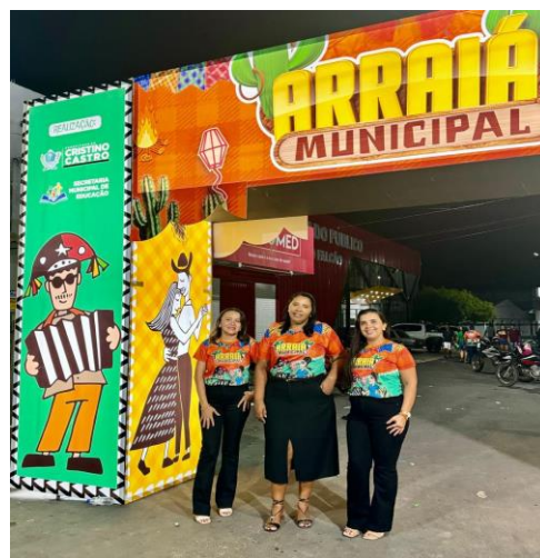
2º Seminário PPAIC