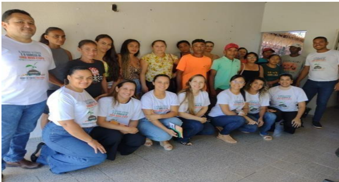
CAPS CAMPANHA SETEMBRO AMARELO