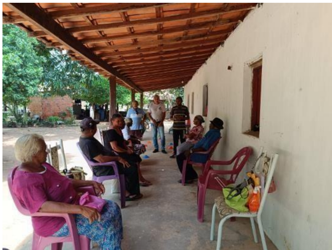
Realização de grupos de Tabagismo no Município de Cristino Castro-PI