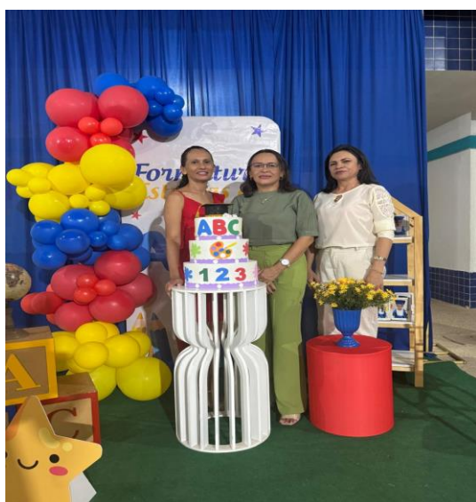
Formatura do ABC