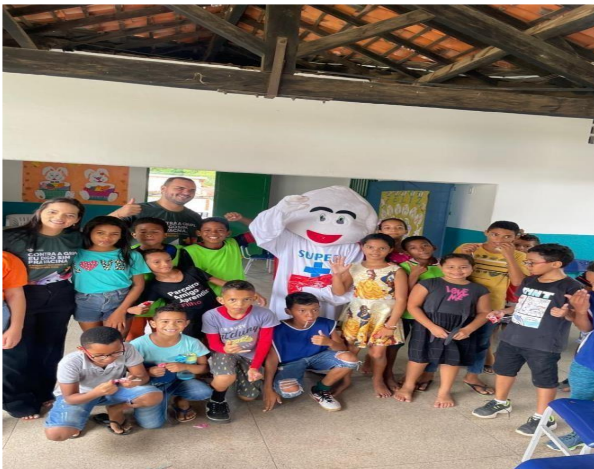
Atividade realizada na Zona Rural – Hiperdia