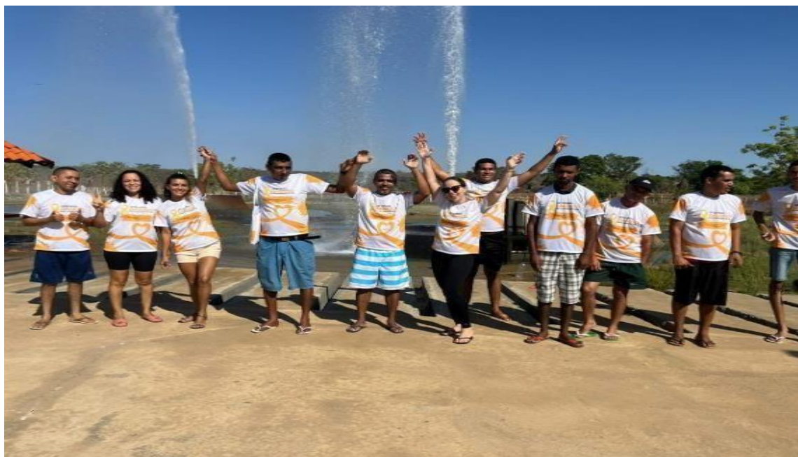
CAPS Oficina Natal