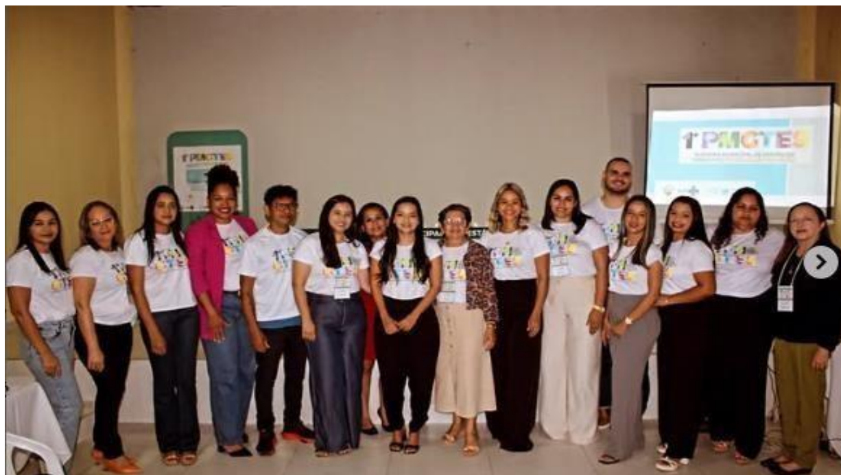
CAPACITAÇÃO ACS- Agente Comunitário de Saúde