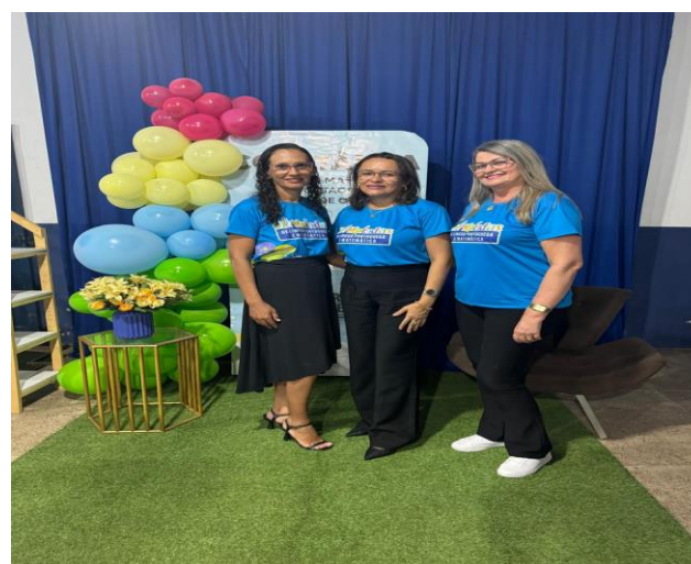
Premiação da Olimpíadas Municipal de Língua Portuguesa e Matemática