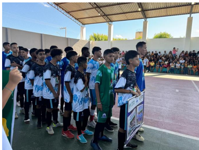
Projeto MPT nas Escolas