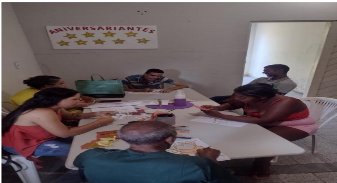
Palestra Saúde Mental (Janeiro Branco)