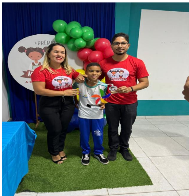
Arraiá das Escolas