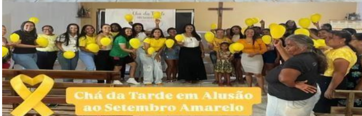
CARRETINHA DA SAÚDE