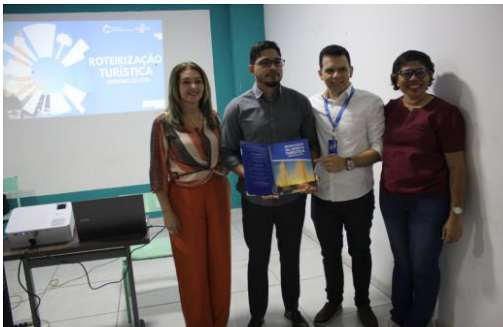
Secretaria Municipal de Turismo na realização do Arraiá Municipal