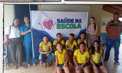
IMAGENS DO PROJETO SAÚDE NA ESCOLA