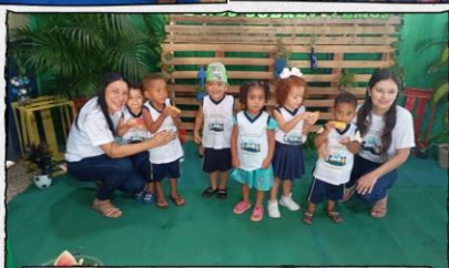
PROJETOS MEIO AMBIENTE 2025