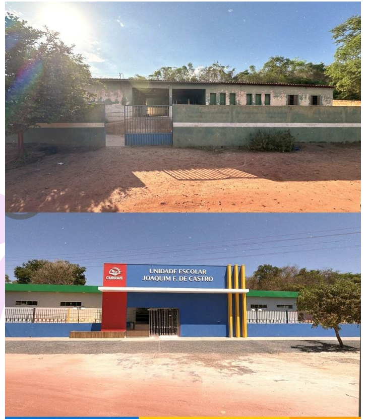
Estamos mostrando o antes e o depois da escola da Comunidade Delícia