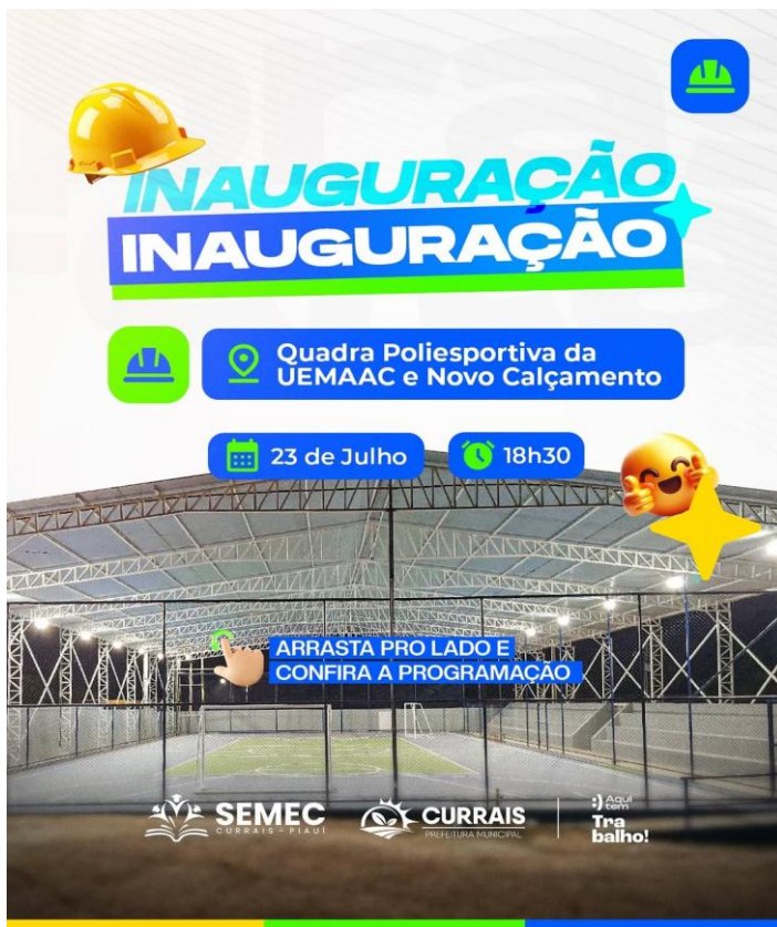
Construção da Quadra da Unidade Escolar Marco Antonio Arantes Costa (BATINS)