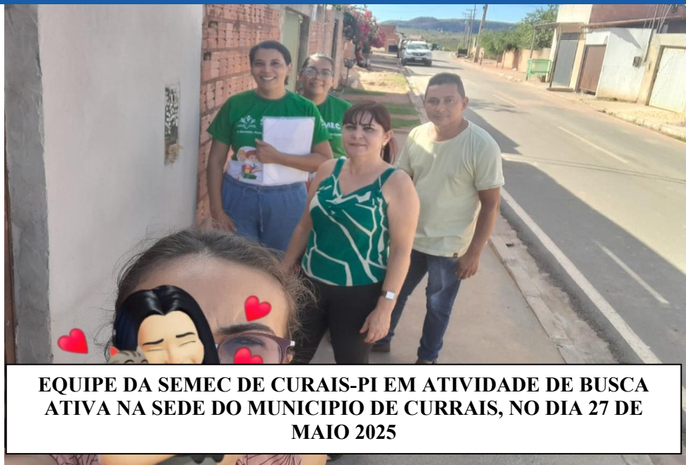
EQUIPE DA SEMEC DE CURRAIS-PI EM ATIVIDADE DE BUSCA ATIVA NA SEDE DO MUNICÍPIO DE CURRAIS, NO DIA 27 DE MAIO 2025