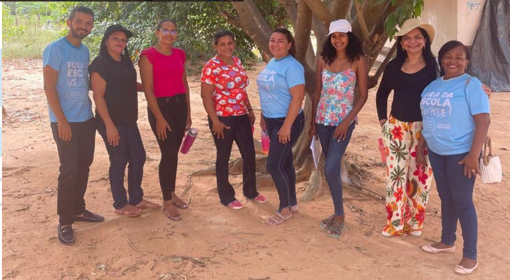
EQUIPE DA SEMEC DE CURRAIS-PI EM ATIVIDADE DE BUSCA ATIVA NA COMUNIDADE BREJO DA CONCEIÇÃO, DIA 22 DE MAIO 2025