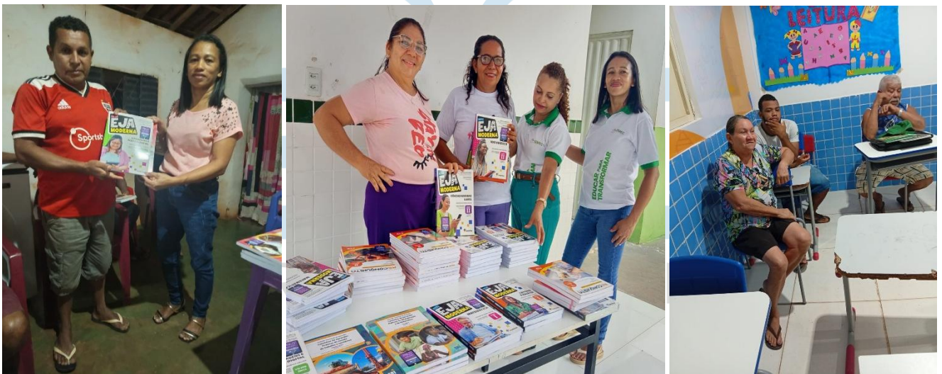
Entrega de Livros da Educação de Jovens e Adultos - EJA

A Educação de Jovens e Adultos – EJA, com cinco anos de duração se destina a jovens, adultos e idosos que não tiveram a oportunidade de cursar o Ensino Fundamental durante a adolescência, permitindo que o educando retome aos estudos e conclua a educação básica em menos tempo.