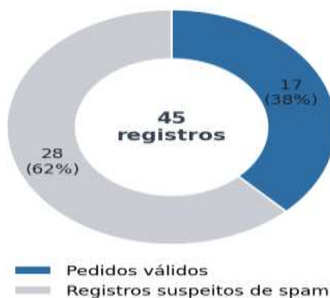
Figura 2 – Composição dos registros recebidos (válidos x suspeitos de spam).

Critério de classificação: foram considerados suspeitos de spam os registros contendo links promocionais, expressões de teste e assuntos sem conteúdo identificável. A classificação é indicativa e pode ser ajustada pelo órgão. Recomenda-se, ainda, a adoção de mecanismo anti-spam (CAPTCHA) no formulário do e-SIC.