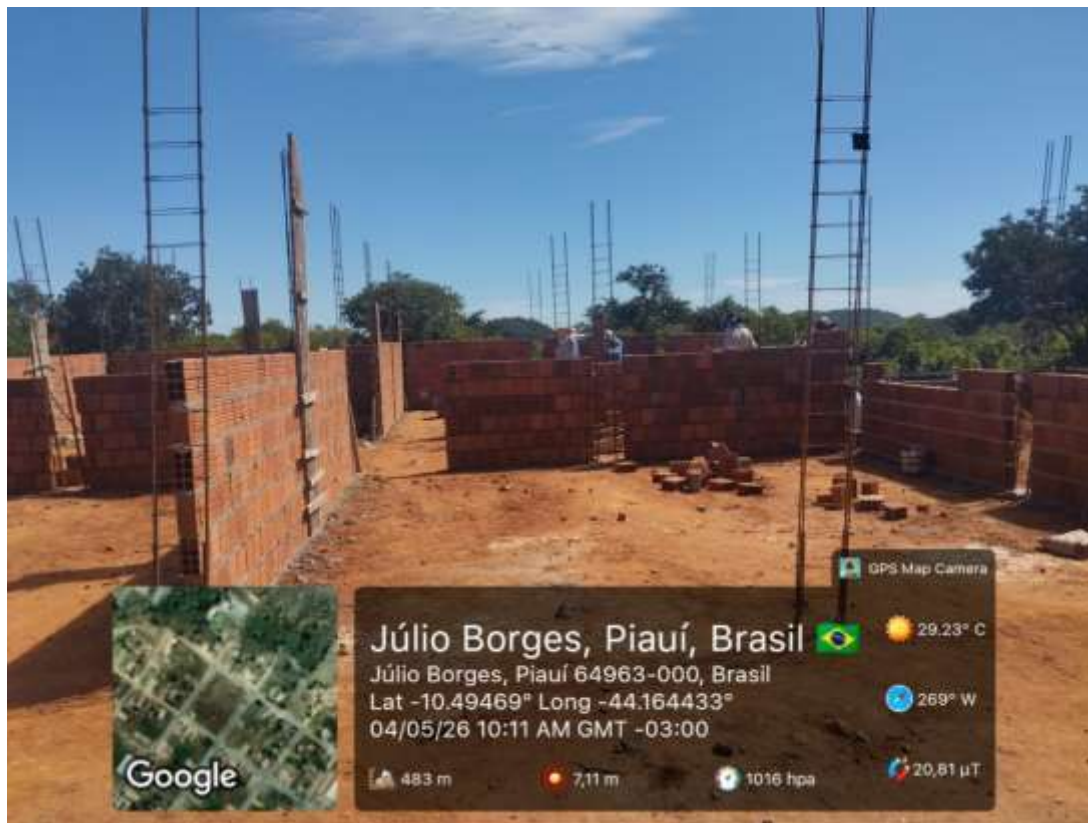
Foto 5: Levantamento de alvenaria de vedação, aterro e apiloamento