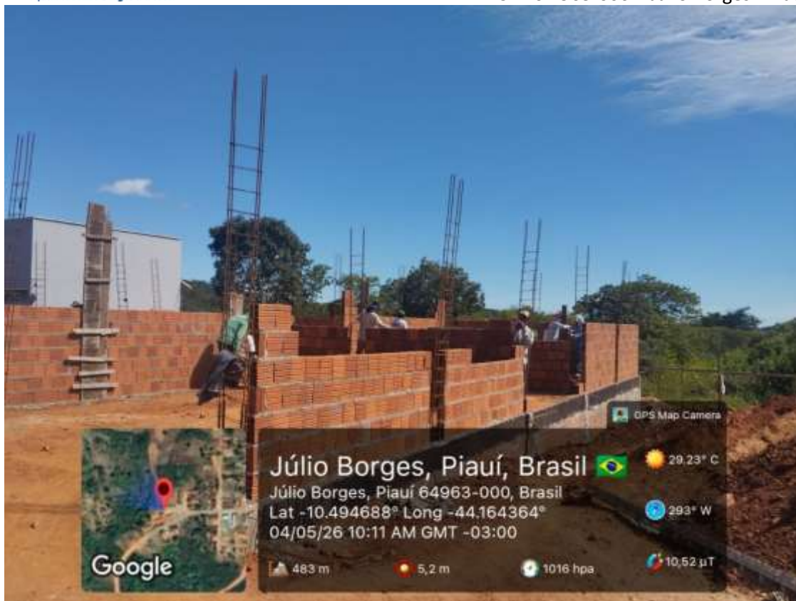
Foto 2: Levantamento de alvenaria de vedação, aterro e apiloamento