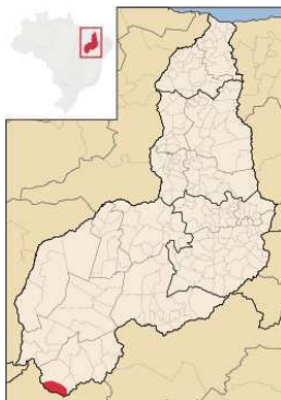
Imagem 1: Localização do município de Cristalândia– PI