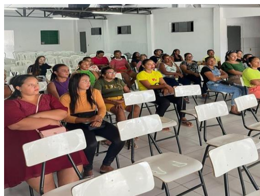
ANEXO: AUDIENCIA PÚBLICA PARA NUCLEÇÃO DAS ESCOLAS MUNICIPAIS (JANEIRO/2025)