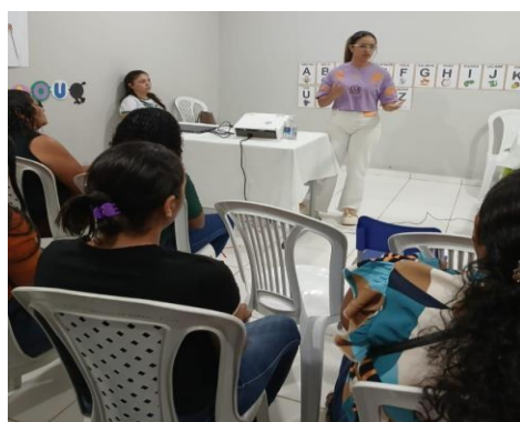
ANEXO: REUNIÃO NUTRICIONISTA COM AS FAMÍLIAS

O município promoveu os encontros de família na escola que representam um pilar essencial para o desenvolvimento integral dos alunos, pois estabelecem uma parceria estratégica que potencializa o aprendizado e o bem-estar emocional e a interação entre família e escola.