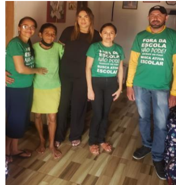
ANEXO: BUSCA ATIVA ESCOLAR (JANEIRO/2025)

O calendário escolar teve início no dia 06 de março de 2025, tivemos uma pequena pausa para a reorganização da mesma e retornamos com suas atividades normais, o nosso município tem um total de 03 unidades escolares distribuídas da seguinte forma: a Escola Municipal João Manoel da Costa, localizado na Rua Manoel Martins nº 67 no centro e possui 220 alunos, do 1º ao 5º ano; 194 alunos do 6º ao 9º ano e 56 alunos da Educação de Jovens e Adultos, totalizando 470 alunos e funciona nos 02 turnos. A Creche Municipal Tia Biluca que fica situada na Rua: Aristides Ramos, s/nº no centro, a creche atende crianças de 1 ano e 6 meses a 3 anos com 87 alunos, 4 e 5 anos 116 alunos perfazendo um total de 203 alunos e funciona em Termpo Integral. A Escola Municipal Manoel Joaquim de Carvalho está situada na localidade São Francisco, zona rural do município, onde recebe alunos desde a Educação Infantil aos anos finais perfazendo um total de 222 alunos e funciona de forma integral.