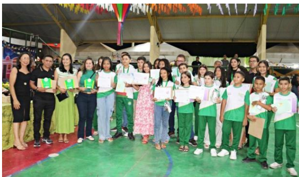
ANEXO: PREMIAÇÃO OLIMPIADAS DO CONHECIMENTO (JUNHO/2025)