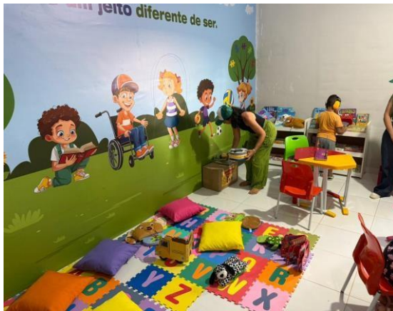
ANEXO: IMPLANTAÇÃO DA AEE