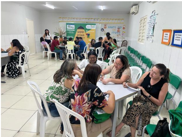
ANEXO: FORMAÇÃO PARA PROFESSORES DA REDE