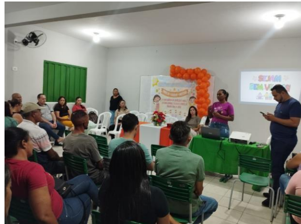
ANEXO: ENCONTRO DE FAMÍLIAS