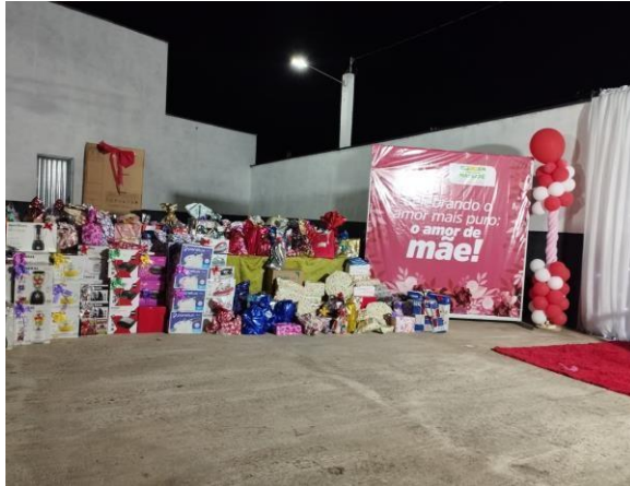
ANEXO: COMEMORAÇÃO DO DIA DAS MÃES (MAIO/25)

As ações da rede municipal ganharam um novo vigor com a realização de atividades comemorativas marcantes. Datas como o dia das mães e o dia das crianças foram celebradas em toda rede de ensino, promovendo momentos de integração entre escola, família e comunidade, reforçando os laços afetivos que sustentam o nosso novo modelo de Educação.