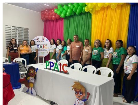
ANEXO: SEMINÁRIO PPAIC

No eixo de formações a Secretaria promoveu capacitação para motoristas e monitores por ser um pilar estratégico para o pleno funcionamento das unidades escolares da rede municipal. A capacitação visa não apenas a atualização em legislação de trânsito e direção defensiva, mas também o aprimoramento de competências essenciais como primeiros socorros, mediação de conflitos e o acolhimento humanizado dos alunos.