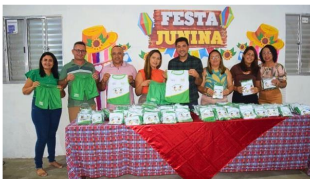
ANEXO: ENTREGA DE FARDAMENTOS ESCOLARES (JUNHO/2025)