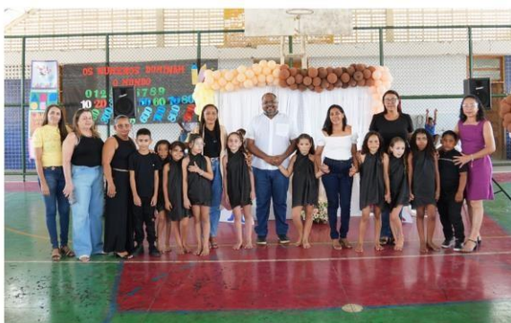
ANEXO: COLÓQUIO PPAIC