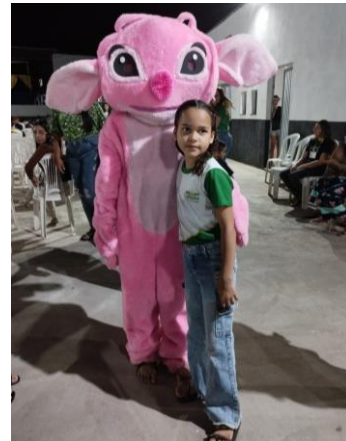
ANEXO: COMEMORAÇÃO DIA DA CRIANÇA

A Secretaria Municipal de Educação demonstrou compromisso com a excelência pedagógica ao cumprir integralmente o cronograma de avaliações externas, incluindo o SAEB, SAEPI e o CNCA/PPAIC. Esse empenho é consolidado por meio do Encontro Formativo do Programa Nacional CNCA/PPAIC e LEEI, que atua como uma estratégia central para transformar os diagnósticos dessas avaliações em intervenções pedagógicas eficazes. Ao aliar o monitoramento da rede à aplicação de avaliações próprias e à valorização do desempenho acadêmico por meio de premiações em olimpíadas do conhecimento, a gestão consolida uma cultura de resultados e incentivo que fortalece o aprendizado e projeta a melhoria contínua dos indicadores educacionais do município.