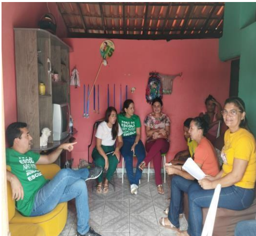
ANEXO: VISITA AS FAMÍLIAS (FEVEREIRO/2025)