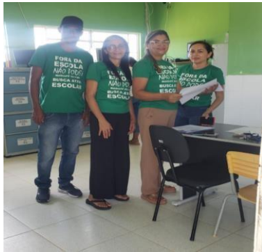
ANEXO: BUSCA ATIVA ESCOLAR (JANEIRO/2025)