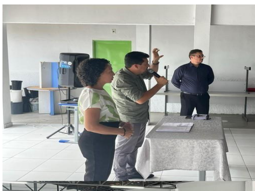
ANEXO: AUDIENCIA PÚBLICA PARA NUCLEÇÃO DAS ESCOLAS MUNICIPAIS (JANEIRO/2025)