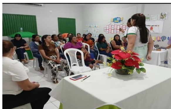
ANEXO: REUNIÃO NUTRICIONISTA COM AS FAMÍLIAS