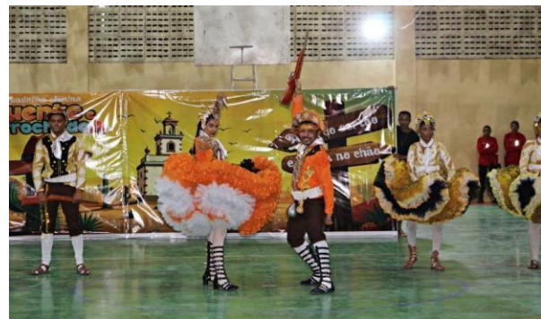
ANEXO: NOITE CULTURAL (JUNHO/2025)

O compromisso com a transformação social se estende a modalidade EJA (Educação de Jovens e Adultos), que recebe atenção especial a nossa rede, além da oferta do ensino qualificado, implementamos o Programa Acreditar e Investir, que realiza a entrega de cestas de alimentos, combatendo a evasão escolar e garantindo a segurança alimentar desses estudantes, como também 75% da frequência.