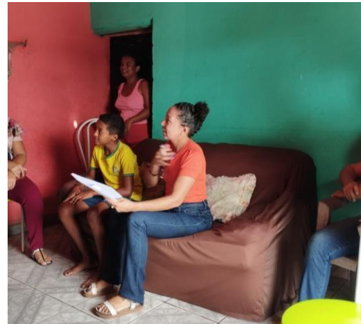
ANEXO: VISITA AS FAMÍLIAS (FEVEREIRO/2025)

A reorganização da rede aderiu também a implantação do Tempo Integral, a transição para o ensino em tempo integral é um dos passos mais significativos para elevar a qualidade da educação pública e reduzir desigualdades sociais. Com o objetivo de viabilizar a oferta da Educação Integral a rede priorizou a ampliação e reforma das unidades escolares. A reestruturação física foi planejada para criar ambientes mais acolhedores e multifuncionais, garantido que o espaço físico acompanhe a expansão da jornada pedagógica e as novas necessidades de convivência dos alunos. Para isso também iniciamos a implantação da Sala de AEE (Sala de Atendimento Educacional), garantindo o suporte necessário aos alunos com deficiência, TGD, e altas habilidades. Esta iniciativa supre uma lacuna histórica da rede, assegurando que a ampliação da jornada escolar seja, de fato, inclusiva e acessível.