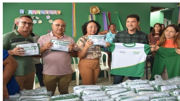
ANEXO: ENTREGA DE FARDAMENTOS ESCOLARES (JUNHO/2025)