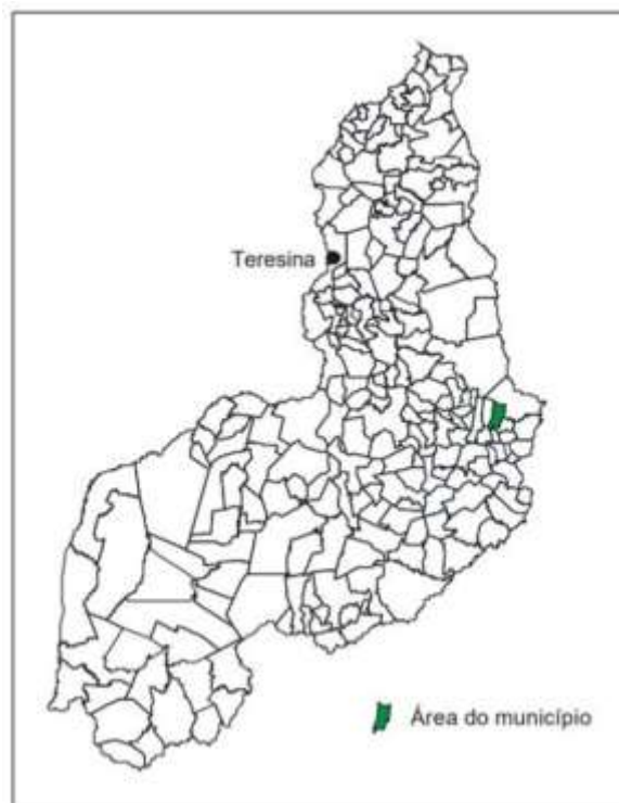
FIGURA 01 – Localização do município.

O município está localizado na microrregião de Pio IX (figura 2), compreendendo uma área irregular de 375 km 2 , tendo como limites os municípios de Pio IX ao norte, ao sul com Campo Grande do Piauí, a oeste com Francisco Santos e, a Leste com Alagoinha do Piauí e Campo Grande do Piauí. A sede municipal tem as coordenadas geográficas de 06o 59'47" de latitude sul e 41o 01'47" de longitude oeste de Greenwich e dista cerca de 369 km de Teresina.