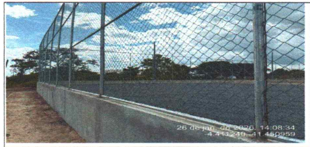
lastros de brita de campo de futebol