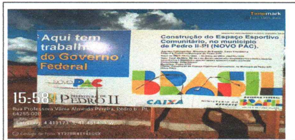
placa da obra