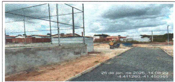
compactação e lastro de pista de caminhada - norte (Coordenadas, comentários, etc.)