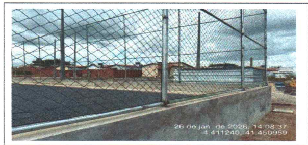
mureta e estrutura de alambrado