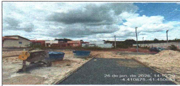
compactação e lastro de pista de caminhada - oeste (Coordenadas, comentários, etc.)