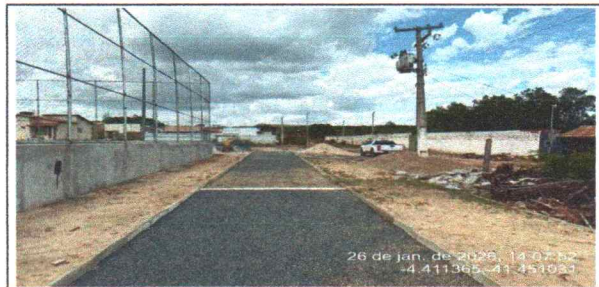
compactação e lastro de pista de caminhada - leste